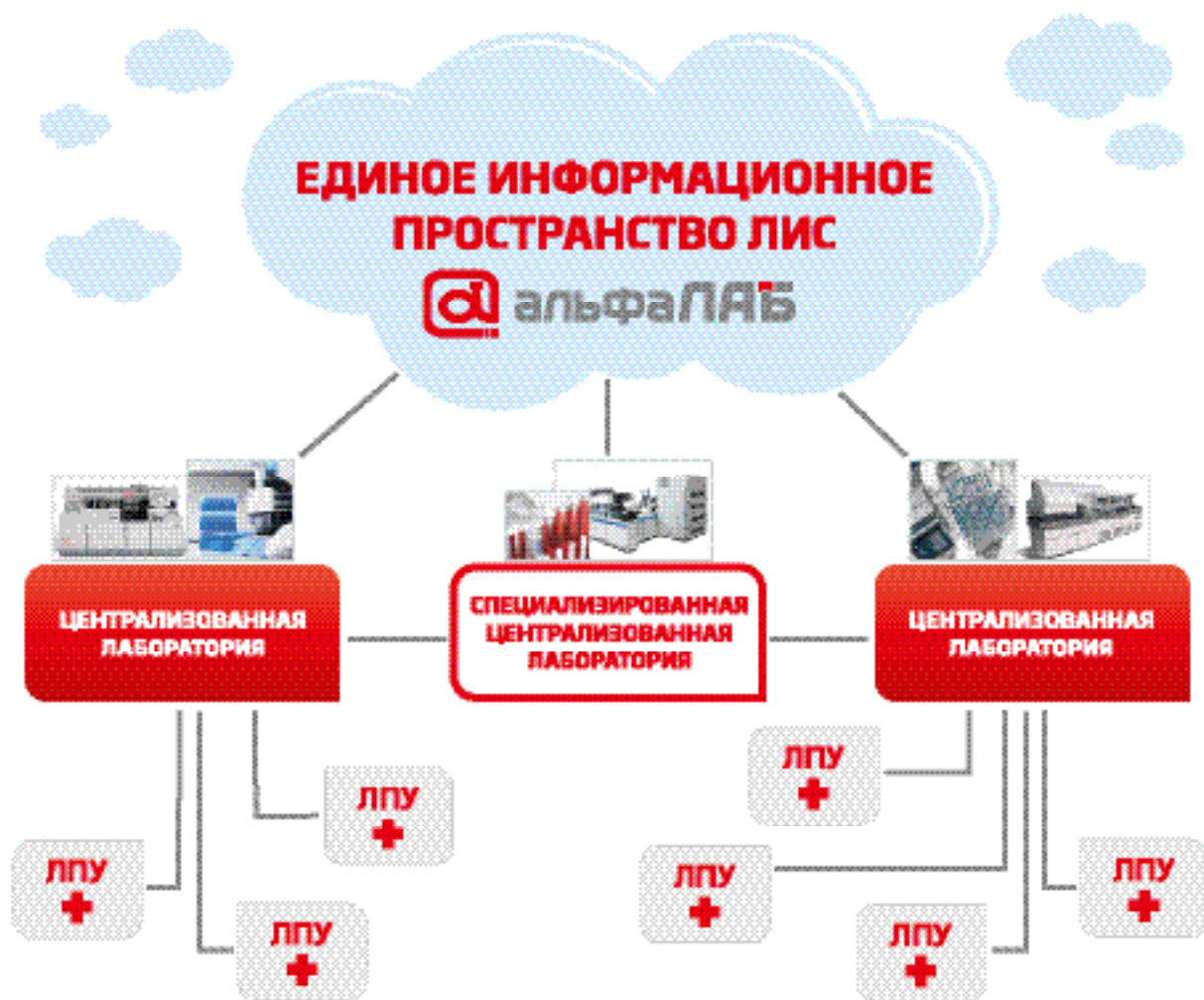
Рис. 2. Комплексная централизация в рамках области или региона