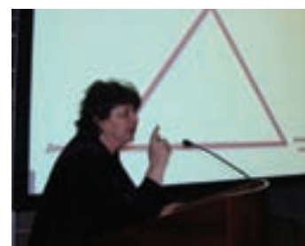
Фото и текст Ирины Евдокимовой

Будьте в курсе вместе с журналом «Поликлиника». Если Вы хотите получить более подробную информацию по мероприятию, обращайтесь в редакцию: Тел.: 8(495)672-70-29 / 92 medpres@mail.ru