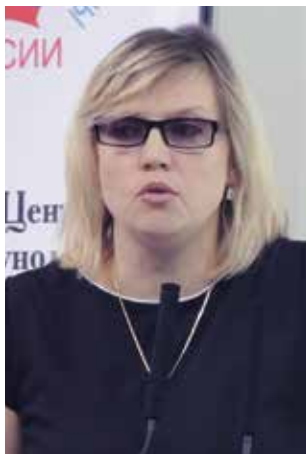
Кесслер Ю.В. Научный центр акушерства, гинекологии и перинатологии и им. академика В.И. Кулакова Минздрава России