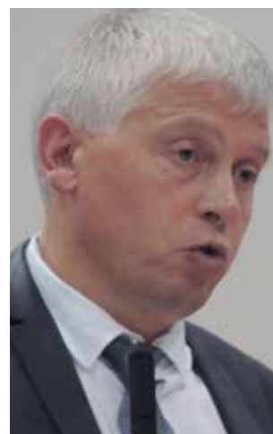
Мазур З.М. Северо-Западный медицинский университет им. И.И. Мечникова Минздрава России